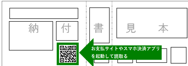
納付書の下部に eL-QR が掲載